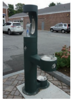
コンコード市内の水飲み場

水ジャーナリスト、アクアコミュニケーター。水課題を抱える現場を調査し情報発信。国や自治体への水政策の提言、子どもや一般市民を対象とする講演活動を行う。